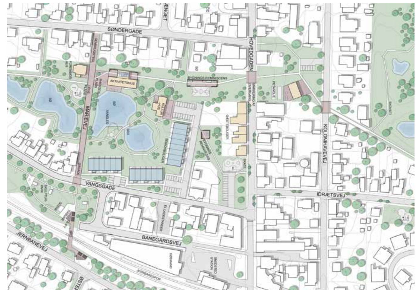
2030 - Planen for området

Hele planen kan du se på www.snedsted2030.dk/planen , hvor du også kan se medlemmerne af bestyrelsen, hvis du har emner du kender vil vende med dem.