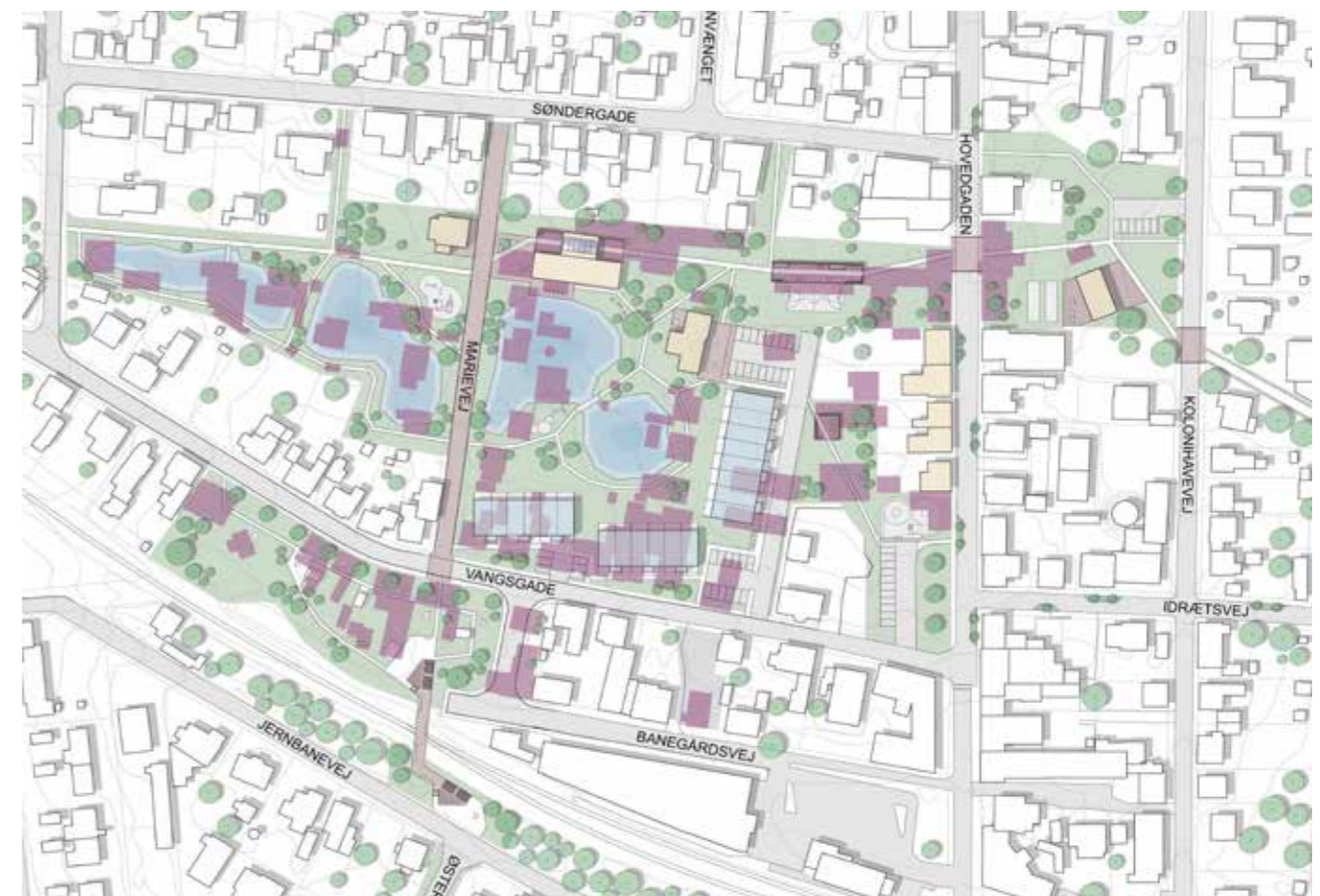
2030 - Røde huse foreslås fjernet, gule huse skal have ny funktion